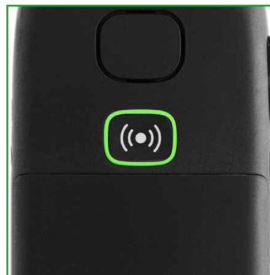
touche SOS au dos